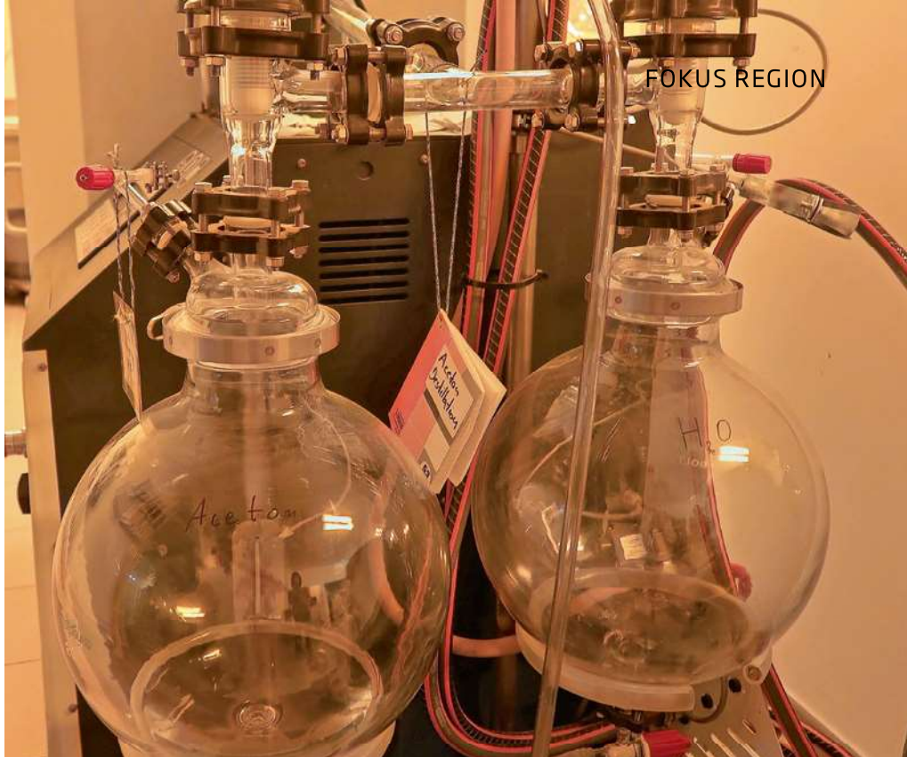
Neue Technik ist eingetroffen, die Anlage „Frida“ ist ein Synthesereaktor. Zum Schutz der Produktionsabläufe wird unter gelbem Licht gearbeitet.

Schon bevor sich Allresist entschieden hatte, an dem Pilotprojekt der IHK teilzunehmen, hat das Unternehmen den Umweltgedanken immer mitgedacht. Er gehört zur DNA des Betriebes. So hat der Firmensitz bei seiner zweiten Erweiterung 2017 ein Gründach erhalten, welches den Wirkungsgrad der bereits 2015 installierten Photovoltaikanlage